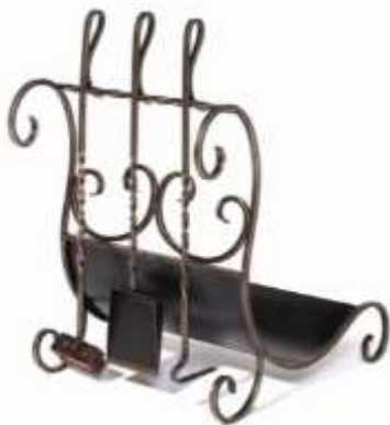
Набір для каміна