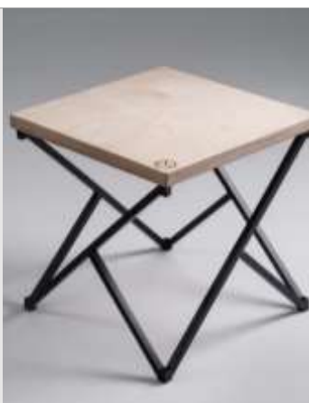
Стілець (столик) декоративний