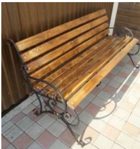
Лавка садово- паркова